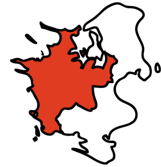
Kulturregion Midt- og Vestsjælland

Kulturregion Midt- og Vestsjælland består af kommunerne Holbæk, Kalundborg, Lejre, Odsherred, Ringsted, Roskilde, Slagelse og Sorø. De 8 kommuner indgik en kulturaftale med Kulturministeriet for perioden 2011 - 2014 med indsatsområderne Talentudvikling, Børne- og ungekultur, Identitet og Kulturarv og International Kunst og Kulturudveksling. Arbejdet med indsatsområderne har ført til en lang række projekter, der alle har en volumen og en kvalitet, der ville være vanskeligt for en enkelt kommune at realisere. Projekterne har alle medvirket til udvikling i såvel hele kulturregionen som i den enkelte kommune. Samarbejde, videndeling, arbejdsdeling. Netværk og involvering på tværs af kommuner og kulturaktører er afgørende for arbejdet i Kulturregion Midt- og Vestsjælland og dermed for mange flotte resultater. giver et overblik over de konkrete projekter der er udsprunget af Kulturaftalen 2011 - 2014.