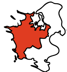
Kulturregion Midt- og Vestsjælland